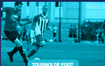
TOURNOI DE FOOT