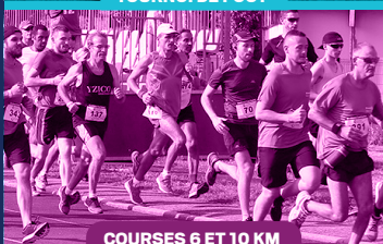
COURSES 6 ET 10 KM