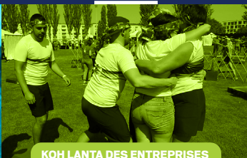
KOH LANTA DES ENTREPRISES