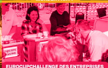
EUROCUPCHALLENGE DES ENTREPRISES